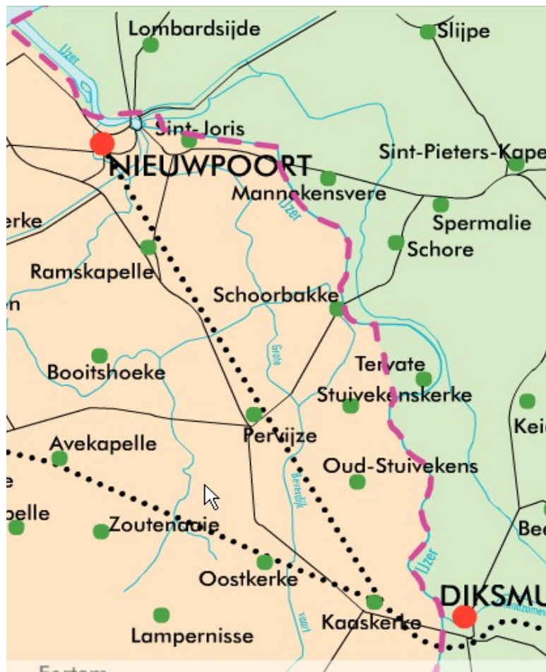
Tekening 1: toestand op 21 oktober 1914: de Belgen zijn teruggedreven tot achter de IJzer.