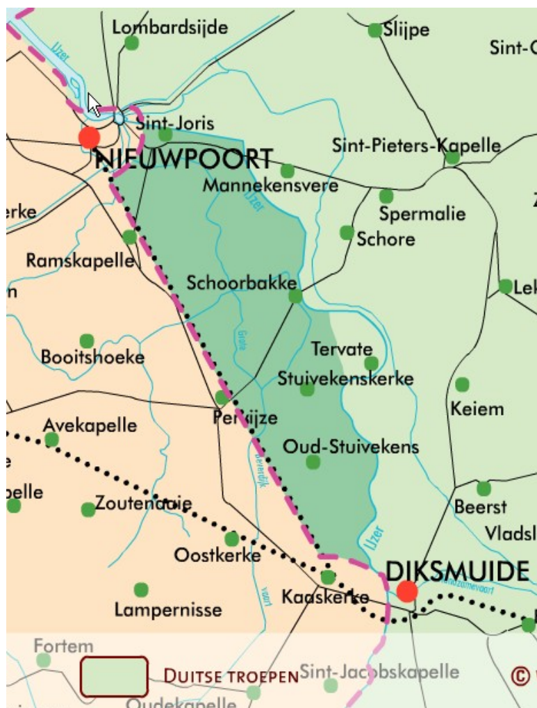
Tekening 2: toestand op 29 oktober: de Duitsers zijn doorgebroken over de IJzer tot de spoorwegbedding.